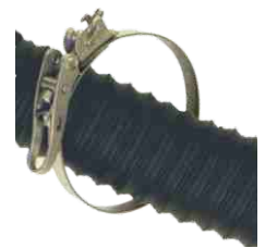
Schnellverschluss 806 Quick release 806