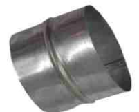
Verbinder 822.0 Joiner 822.0