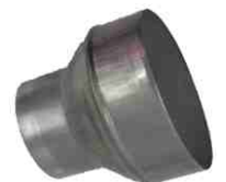
Reduzierung 829.0 Reducer 829.0