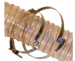
Brückenschelle 801 Bridge clamp 801